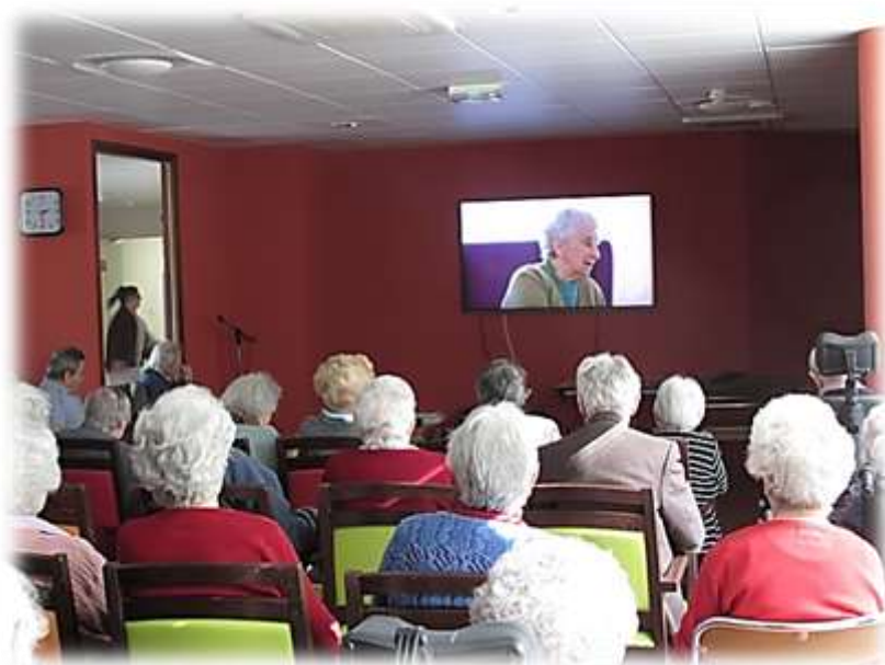
Projection du film à la Résidence