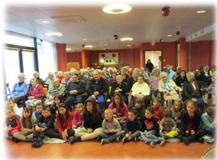
Arbre de Noël des enfants du personnel, spectacle de magie