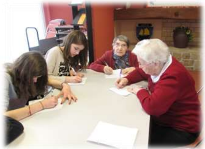
Atelier Dictée !!!