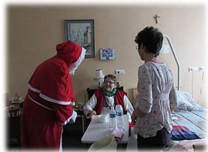
Distribution des colis par le CCAS