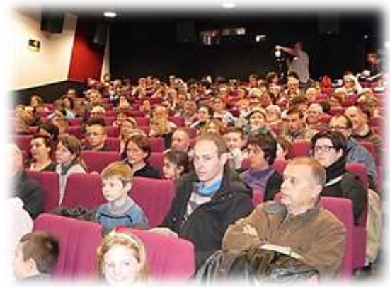
Salle comble au cinéma

Nous aimerions bien refaire un autre film, nous avons encore plein de chose à raconter, sur les animaux, la pêche ou les rivières. Nous voulons bien recommencer mais à condition qu'il ait autant de succès que le premier !!