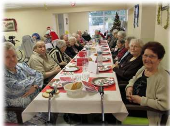
Repas de Noël