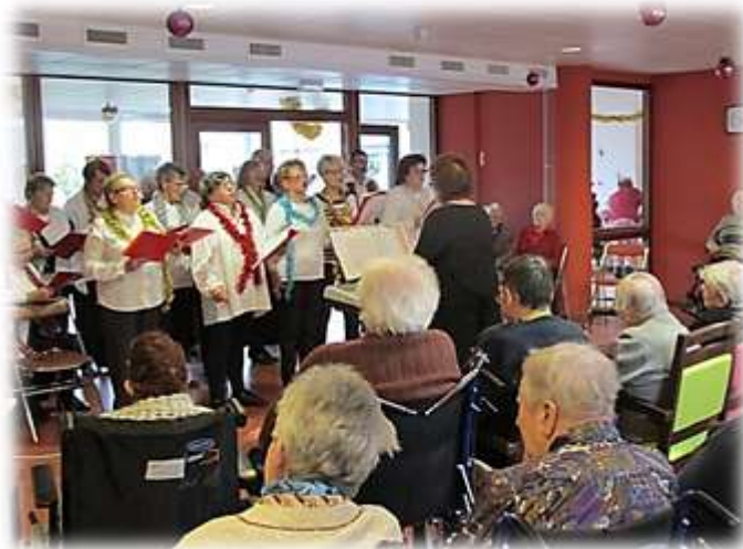
Chant de Noël avec la chorale de st Martin de Landelles