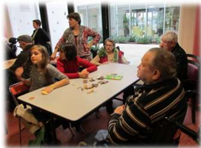
Projet « un homme un arbre »