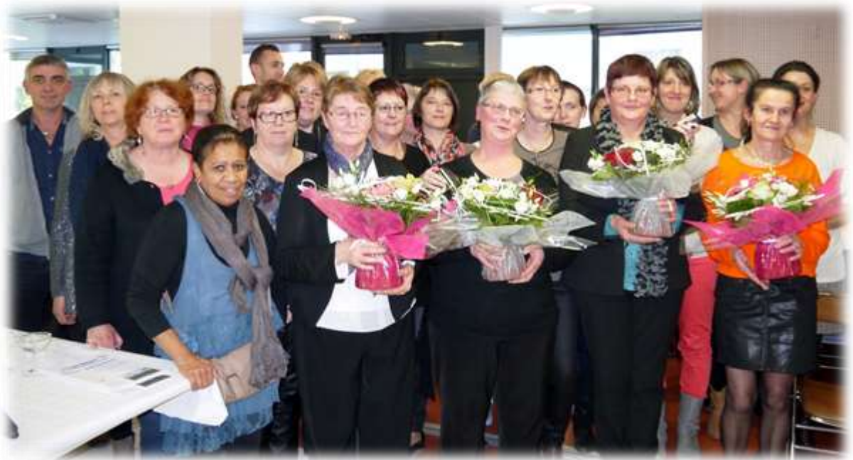
Nos retraitées entourés des membres du personnel