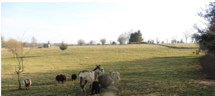
Un cadre de travail agréable est un élément de la qualité de vie au travail !

L'éco-pâturage permet de créer un site agréable tant pour nos usagers et leurs proches que pour le personnel du CHMB. Nos résidents et les familles peuvent se promener dans les lieux calmes, être en contact avec les animaux. C'est un moyen supplémentaire de conserver le lien social.